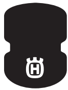
Robotic lawn mower