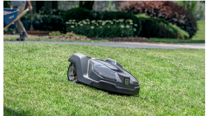
Automower® 430X är en avancerad, fullstor robotklippare som klarar stora och komplexa gräsmattor.

Hela Pricerunners test om grästrimmers finns här .