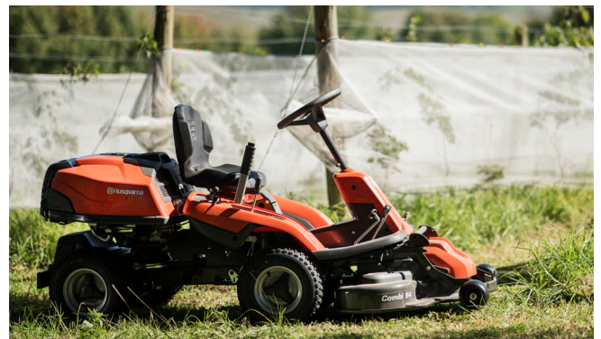
R 214TC är en flexibel och kraftfull rider med en tvåcylindrig motor, utmärkt styrförmåga och automatisk knivaktivering.