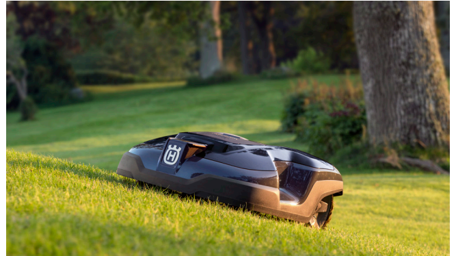
Husqvarna Automower® 310 är en effektiv robotgräsklippare för ytor upp till 1 000 m 2 som utan problem hanterar lutningar på 40 procent.

Husqvarna 115iL är en lättanvänd batteridrivna grästrimmer som inte stör grannarna. Den intuitiva knappsatsen gör det enkelt att starta och stoppa maskinen. Det teleskopiska riggröret och det justerbara handtaget gör det möjligt att hitta en bekväm arbetsställning. Trimmern har en borstlös motor med högt vridmoment, vilket ger ökad effektivitet, lägre buller och längre livslängd. Klippsystemet är kraftigt med dubbla linor och funktionen Tap'n Go ger snabb linmatning. Trimmern har vunnit "Bäst i test" fyra år i rad med omdömen som "tystlåten men kraftfull" och "skön att vända och har bra ergonomi". Rek. pris: 2 190 kr.