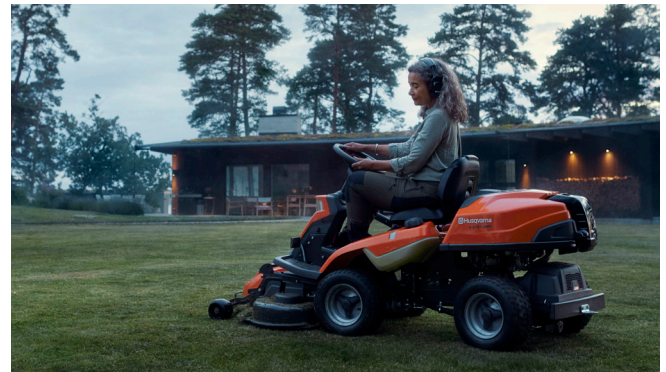
R 216T AWD är en fyrhjulsdreven rider som kombinerar enkel användning och utmärkt hantering med kraft och prestanda.