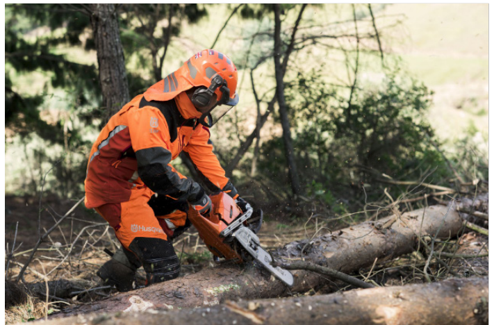
Husqvarnan uuden sukupolven ammattisahat soveltuvat nopeaan, joustavuutta vaativaan hakkuu- ja kaatotyöhön erilaisissa olosuhteissa.