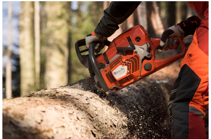
572XP@-sahan teho-painosuhte on parempi verrattuna saman kokoluokan moottorisahoihin.

Soft cut out -järjestelmä (eräänlainen moottorinohjaus) suojaa moottoria tulvimiselta ja järjestelmä säättää sytytyksen automaattisesti maksimikierroksilla. Tämän ansiosta paine moottoriin on 30 % pienempi verrattuna niihin Husqvarnan moottorisahoihin, joissa ei ole tätä toimintoa. Tuloksena on tasaisempi käynti, alhaisempi työskentelylämpötila ja maksimaalinen käyttöaika.