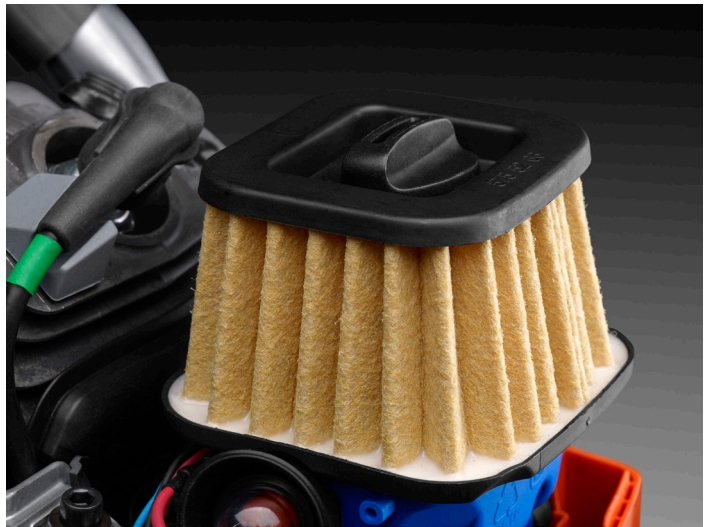
Uuden ilmansuodattimen suuri suodatinala suodattaa tehokkaasti pidentäen samalla käyttöaika.