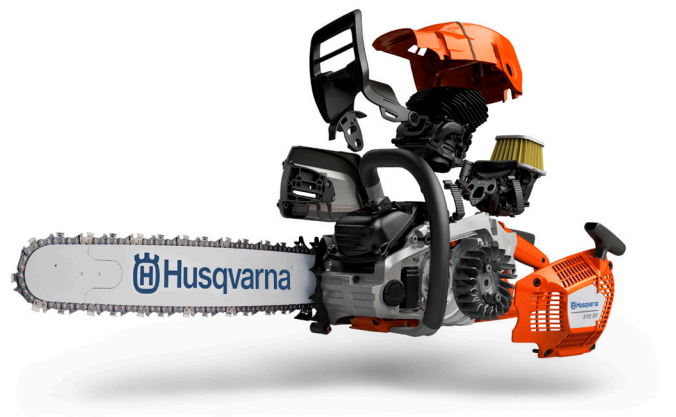
AutoTune™ on päivitetty, ja automaattinen säätö tapahtuu nyt kymmenen kertaa aiempaa nopeammin.